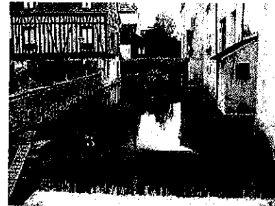
quartier de la pêche

Cette nombreuse présence fluviale fait le charme de Montargis appelé « la Venise du Gâtinais » et « la ville aux cent ponts ».