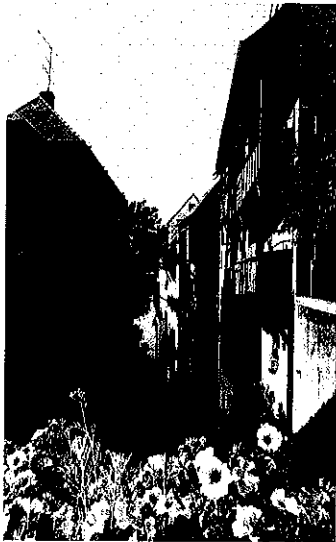
rue du Général Leclerc

Montargis est une commune située dans le département du Loiret, en région Centre-Val de Loire.