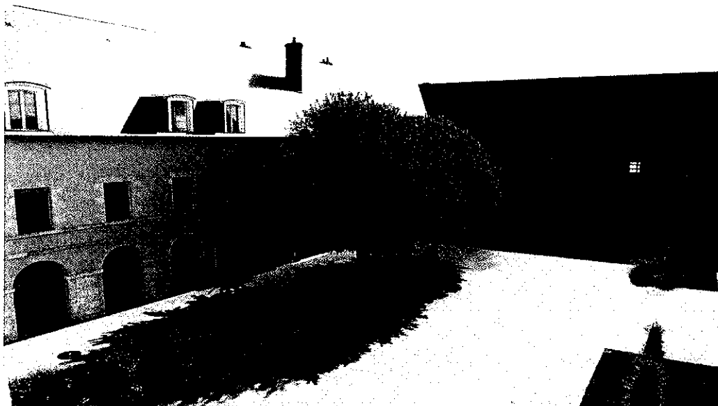
vue de la cour intérieure du palais de justice

Le palais de justice de Montargis est situé au cœur de la ville, au pied des vestiges de l'ancien château royal et à proximité de la mairie et de l'artère commerciale de la ville. Il est installé dans l'ancien couvent de l'ordre de Sainte-Marie de la Visitation créé en 1628 et dont il a conservé les arcades. Il enlace le Vernisson et le Puiseaux ce qui rajoute au charme du bâtiment.